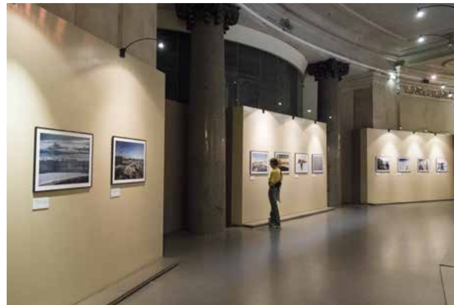
Le Raid - Palais de la Découverte - Paris - 2014