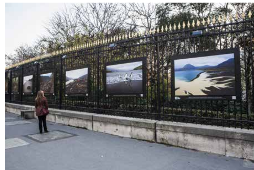
Coeurs de Nature - Jardin du Luxembourg - Paris - 2011